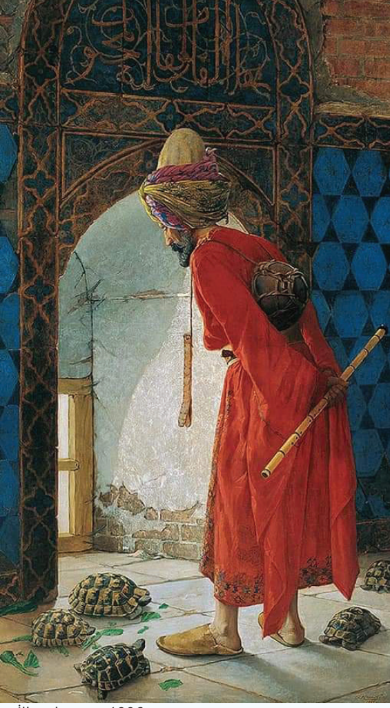
İlk çalışması 1906

Çünkü o ağırkanlı hayvanların öğrenmeye hevesli olmadıkları apaçık ortadaydı. Kaplumbağaların bazıları ona sırtını dönüp uzaklara gitmeye başlamıştı bile. Başlarında diki len adamın sabırlı olmaktan başka bir çaresi yoktu. Osman Hamdi yeni tablosunda adeta kendi hayat hikâyesini özetlemişti. Batılulaştırmaya çalıştığı muhafazakâr bir toplumda eğitici rolü oynamak gerçekten de iğneyle kuyu kazmaya benziyordu.” (s. 314)*